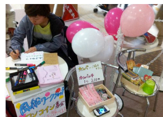
(東北応援ビレッジ)